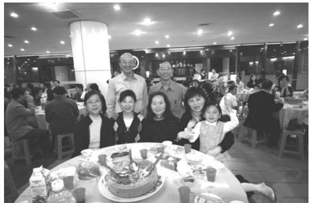
圖4. 晚宴中系友合照