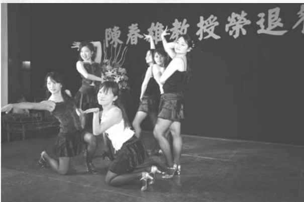
圖5. 年輕系友表演拉丁爵士舞