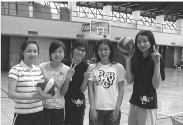
充滿青春活力的女排

在聖誕季節舉辦的系運（12月24、25日），連獎牌都很有聖誕氣氛，我們將巧克力製作成獎牌的形狀，並把護貝好的獎項名稱和其結合在一起，感覺真的很高級，除了這個巧思之外，比賽的規劃安排也非常仔細，包括壘球、籃球、排球、羽球、桌球…等，醫體的運動場上散發著藥學的活力。