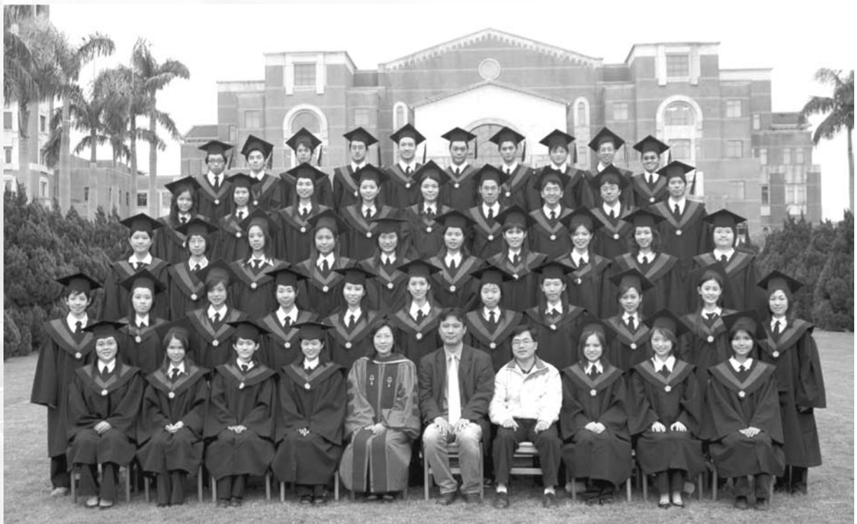
國立臺灣大學醫學院藥學系 第五十屆畢業生 合影留念 19u. Nov, 2005

人都要留在相片裡，也要牢記在腦海中，在總圖前的草地上，往日的回憶在心頭翻起，我們曾經也在總區上課、一同走在椰林大道上，那是我們共同的經歷，磨滅不了的回憶，站在這裡，是因為一段巧妙的緣份，很幸運能夠認識每一個人，畢業團照，不是單純相片上的紀錄，更包含了許許多多的含意。