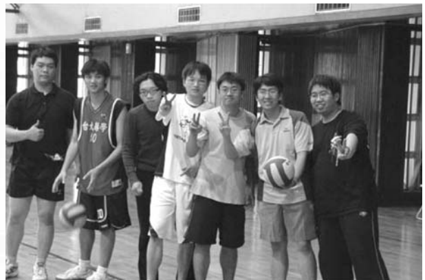
開賽前的男排，很有自信的樣子呢