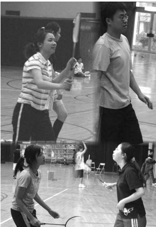
爆發力十足的羽球賽