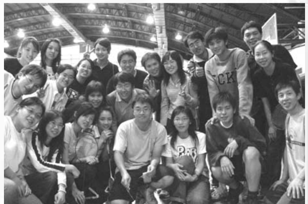
比賽後的慶生會，真開心

系運是藥胞們散發熱情活力的地方，也聯絡了各系級之間的感情，藉著各項比賽，大家互相切磋，也讓12月的冬天不再寒冷！期待2006年的系運，大家再度齊聚一堂，展現各項球技，互相砥礪。 ❖