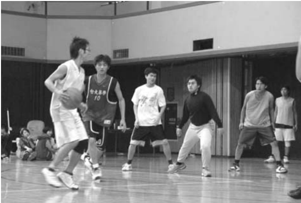
激烈的籃球賽，大家都好認真喔！