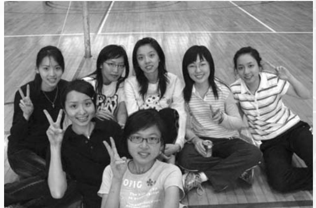
參賽者化身為場下熱情的啦啦隊