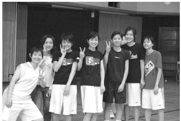
場下甜美，場上衝勁十足的女籃