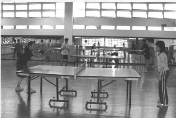
在醫體二樓的桌球賽