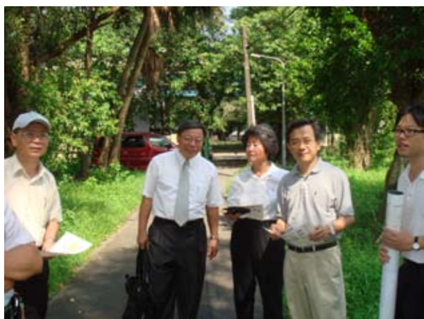
校總區管理學院旁基地（一）