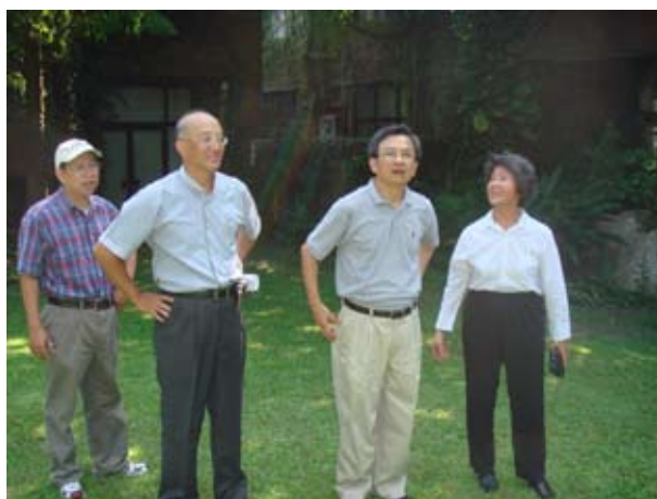
校總區管理學院旁基地（二）