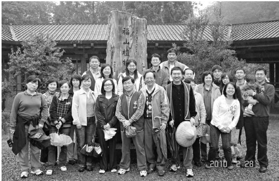
中長程規劃會議合照