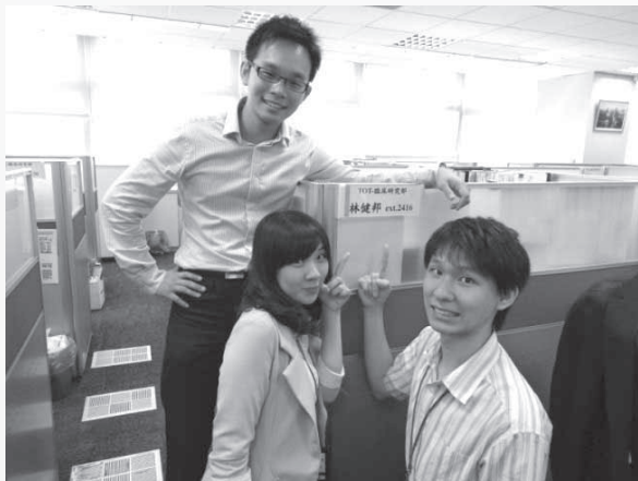
與實習帶領人合影

在此，很感謝台灣東洋願意提供這樣的實習計畫，也鼓勵學弟妹們在未來能把握這樣的機會。