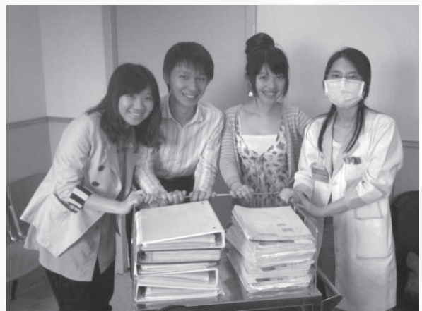
實際到醫院執行CRA的工作